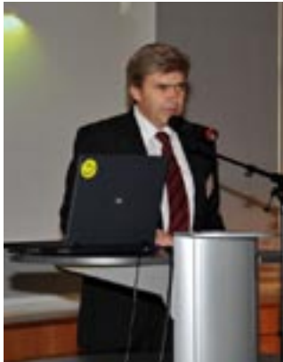
Dir. Karl Scherleithner