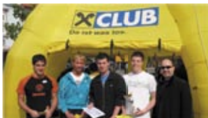
Das Siegerteam des Riesenwuzlerturniers am Clubstand beim Marktfest Pitten