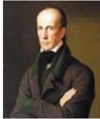
Erzherzog Johann, ein Freund und Förderer der Thernberger

Erzherzog Johann war über zwanzig Jahre Besitzer der Herrschaft Thernberg und machte hier erste landwirtschaftliche Versuche, legte Versuchsgärten an und begann seine umfangreiche Sammlung zusammenzustellen. Diese bildete später den Grundstock des Grazer Joaneums.